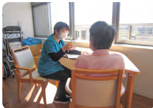
管理栄養士による栄養指導