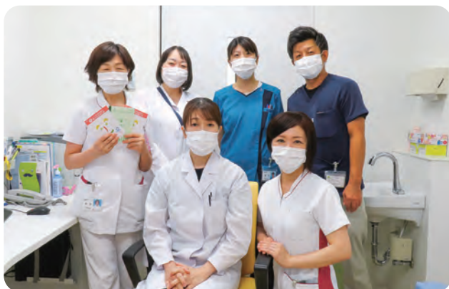
糖尿病外来診療チーム