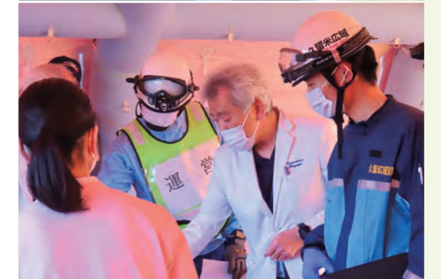
久留米広域消防本部で災害救護訓練で陣頭指揮をとる様子

を有効に活用し、病院同士や地域の施設との連携を強化するだけでなく、ITやAIといった新しい技術も積極的に取り入れて、より効率的で質の高い医療を提供できる体制を整えてまいります。神代病院は、地域の皆様の「かかりつけ医」機能を持つ病院として、住み慣れた地域で安心して生活を続けられるよう、医療と介護が切れ目なく連携できる体制の充実を図ってまいります。