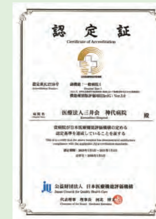
副機能:一般病院1 機能種別版評価項目3rdG: Ver.3.0 認定期間:2026年1月5日～2031年1月4日