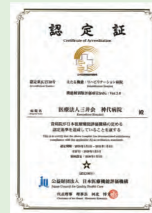
主たる機能:リハビリテーション病院 機能種別版評価項目3rdG: Ver.3.0 認定期間:2026年1月5日～2031年1月4日