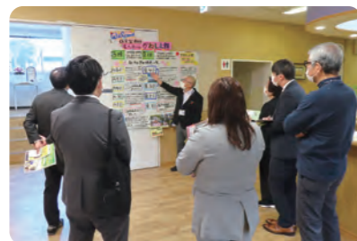
かねしま館をはじめとする介護施設の取組にも関心をお寄せいただきました。