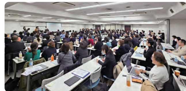
当日は200名を超える医療従事者の皆様にご参加いただきました。