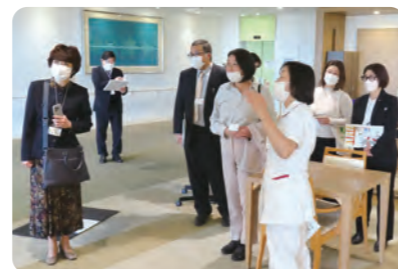
神代病院施設内は、1階から5階まで全フロアの役割をご説明しました。