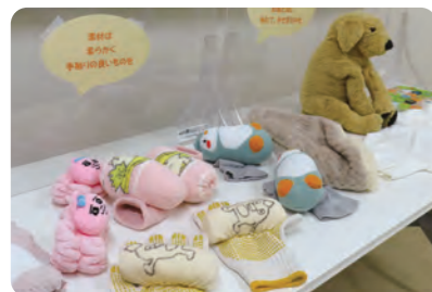
神代病院がオリジナルで作成した入院患者の皆様を「ケアするグッズ」